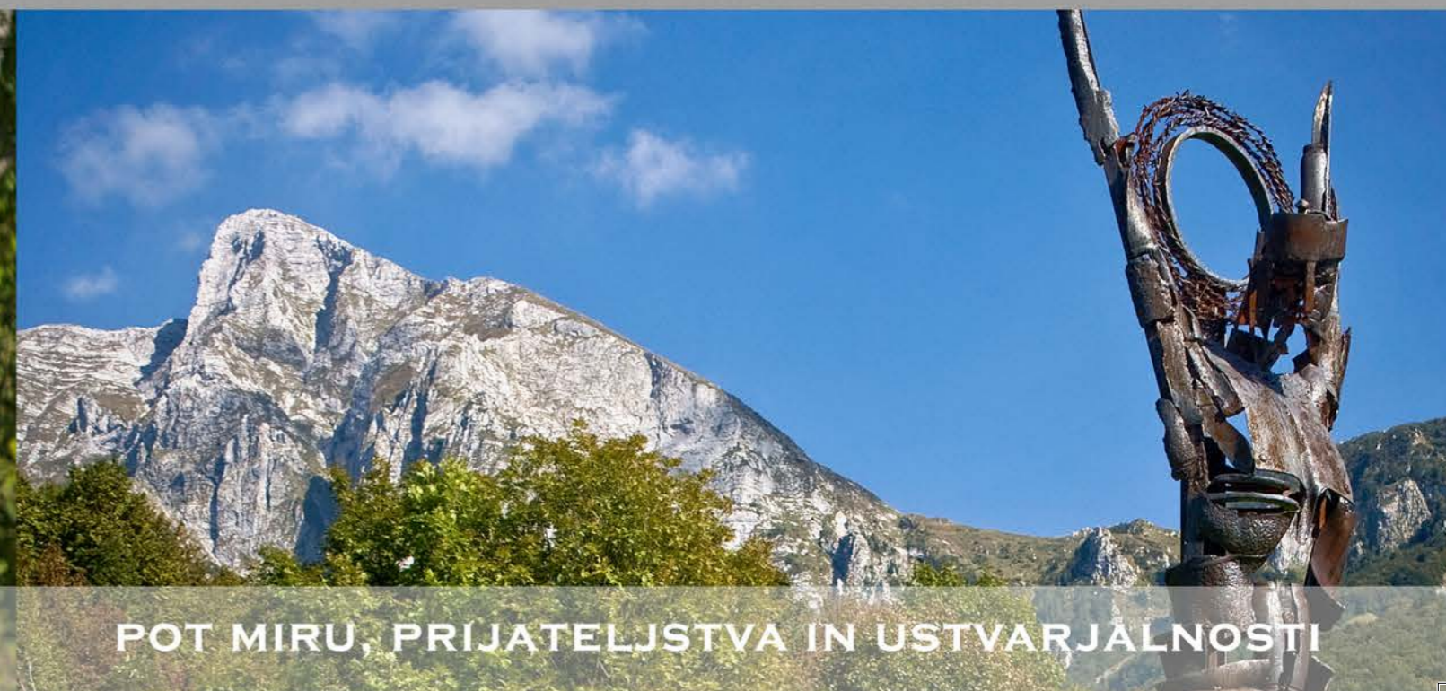
POT MIRU, PRIJATELJSTVA IN USTVARJALNOSTI