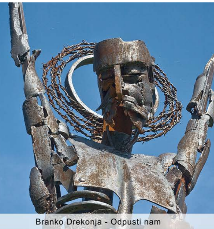
Branko Drekonja - Odpusti nam