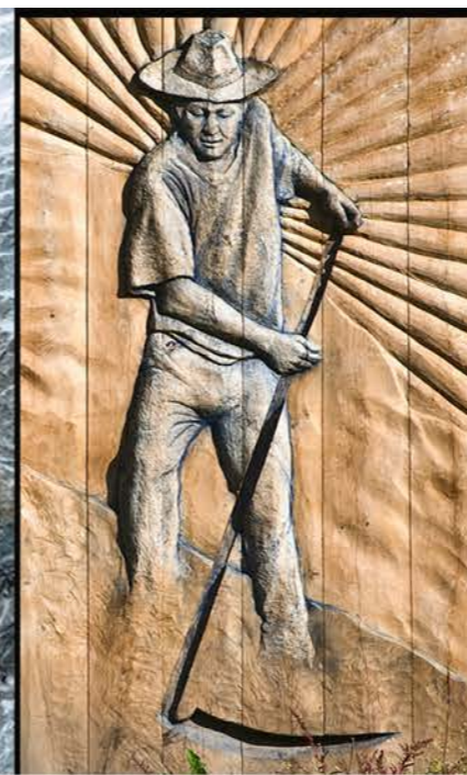
Vasja Kavčič - Kosec